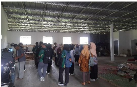
Gambar 4. Observasi awal sebelum memberikan mentoring

Selanjutnya, peserta diberikan materi mengenai potensi TikTok sebagai media promosi yang mampu menjangkau audiens secara luas melalui konten video pendek. Dalam kegiatan ini juga dipaparkan berbagai contoh UMKM kerajinan yang berhasil memanfaatkan TikTok sebagai media pemasaran produk. Selain itu, peserta memperoleh informasi mengenai tren perilaku konsumen di media sosial yang dapat menjadi dasar dalam menyusun strategi promosi produk secara lebih efektif. Selama kegiatan berlangsung, peserta terlibat aktif dalam sesi diskusi dan tanya jawab terkait peluang pemanfaatan TikTok dalam mendukung pemasaran produk kerajinan mendong.