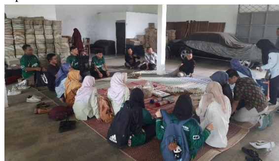
Gambar 7. Diskusi dan evaluasi mengenai kegiatan pengembangan literasi sosial media