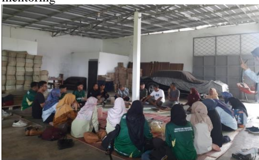
Gambar 6. Mentoring mengenai media sosial Tiktok untuk membantu pemasaran produk