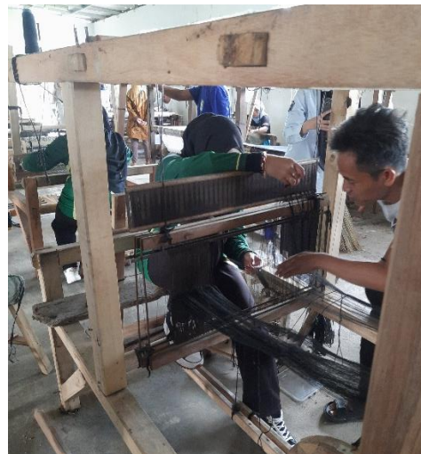
Gambar 3. Menganyak tikar dari mendong

Kondisi tersebut menyebabkan potensi pemasaran digital yang sebenarnya dapat menjangkau konsumen lebih luas belum dimanfaatkan secara maksimal oleh mitra. Selain itu, hasil need assessment menunjukkan bahwa peserta memiliki antusiasme yang tinggi terhadap penggunaan media sosial sebagai sarana pemasaran. Namun demikian, terdapat keterbatasan pengetahuan mengenai teknik pembuatan konten digital, branding produk, penyusunan caption promosi, penggunaan hashtag yang relevan, serta strategi untuk meningkatkan jangkauan dan keterlibatan audiens dalam media sosial. Temuan tersebut menjadi dasar bagi tim pengabdian untuk merancang kegiatan mentoring yang berfokus pada peningkatan literasi media sosial melalui pemanfaatan TikTok sebagai media pemasaran produk kerajinan mendong.