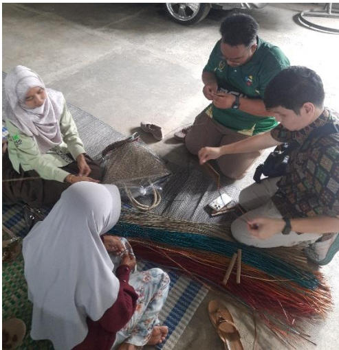
Gambar 2. Produk tas dari mendong