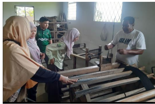
Gambar 5. Pengenalan produk mendong yang akan dipasarkan