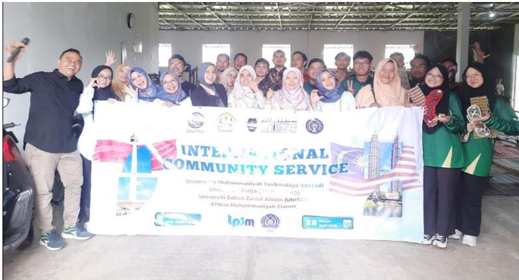
Gambar 1. Tim Pengabdian Masyarakat UMTAS dan UNISZA

terbatas pada kebutuhan komunikasi personal dan belum diarahkan sebagai media promosi, branding, maupun perluasan pasar produk kerajinan mendong