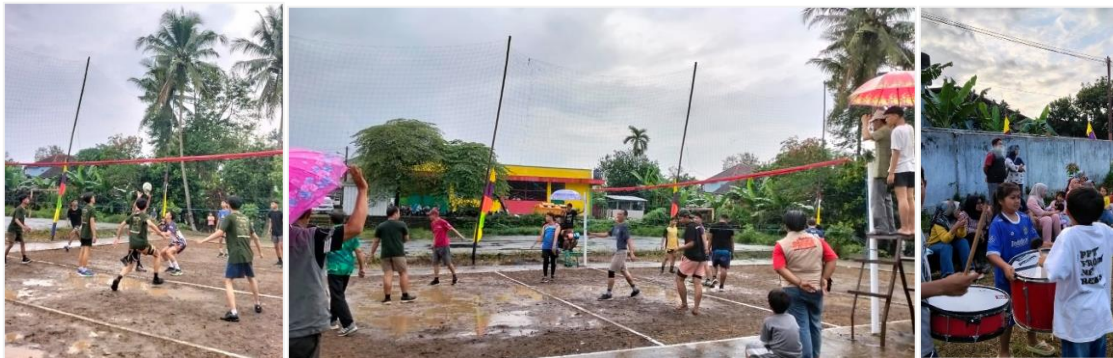
Gambar 6. Dokumentasi tim KKN dan tim Karang Taruna

Seluruh rangkaian pertandingan voli akan dilaksanakan mulai tanggal 10 hingga 16 Agustus. Rangkaian dimulai pada hari pertama, Minggu, 10 Agustus 2025, dengan jadwal pertandingan sejak pukul 08.00 WIB hingga 17.00 WIB. Pada hari berikutnya, yaitu 11 sampai dengan 14 Agustus 2025, pertandingan dijadwalkan setiap sore, tepatnya pukul 15.00 WIB hingga 17.30 WIB. Selanjutnya, pada Jumat, 15 Agustus 2025, akan digelar babak semi final yang dimulai lebih awal, yakni pukul 13.30 WIB hingga 17.30 WIB. Puncak acara, yaitu babak grand final, akan berlangsung pada Sabtu, 16 Agustus 2025, mulai pukul 15.30 WIB hingga selesai. Dengan jadwal yang tersusun rapi ini, diharapkan seluruh rangkaian pertandingan dapat berjalan lancar dan mendapat antusiasme tinggi dari masyarakat.