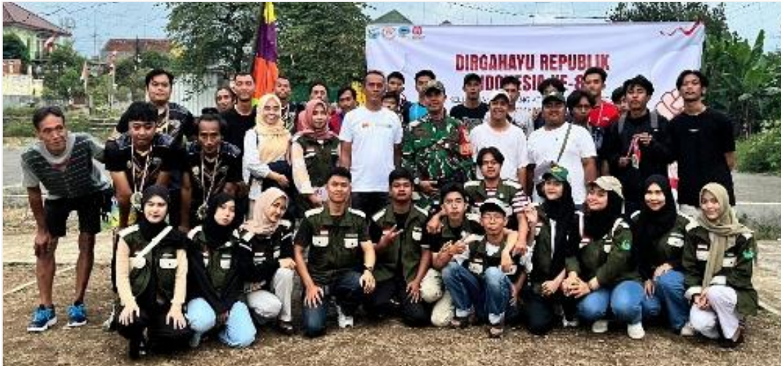
Gambar 7. Dokumentasi penutupan turnamen voli

Pelaksanaan turnamen voli ini membuktikan bahwa olahraga dapat menjadi instrumen multifungsi. Tidak hanya sebagai sarana rekreasi dan peringatan hari kemerdekaan, tetapi juga efektif dalam mendorong perputaran ekonomi lokal.