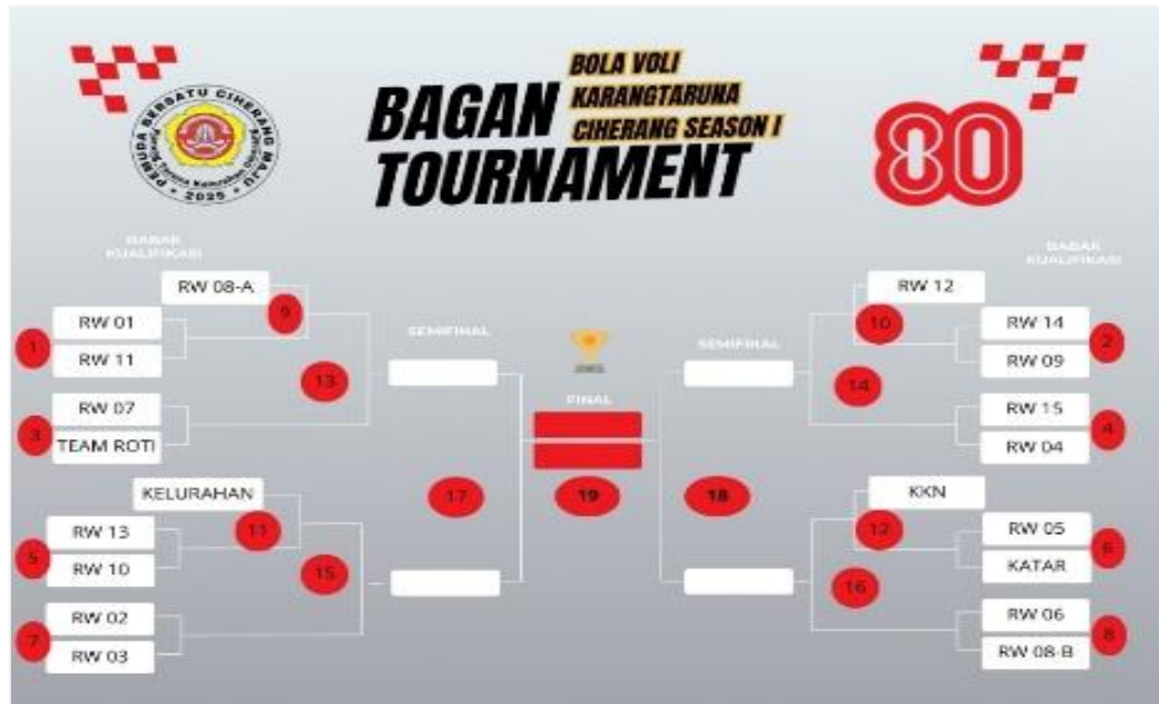
Gambar 3. Skema bagan turnamen voli