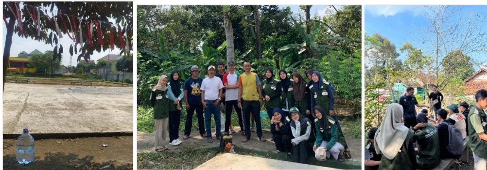
Gambar 2. Penataan dan membersihkan lapang Kelurahan Ciharang

Pada fase persiapan, panitia menyiapkan rancangan bagan pertandingan, menyusun jadwal kegiatan, dan melakukan komunikasi dengan masyarakat yang menjadi sasaran program (Khaerul et al., 2022).