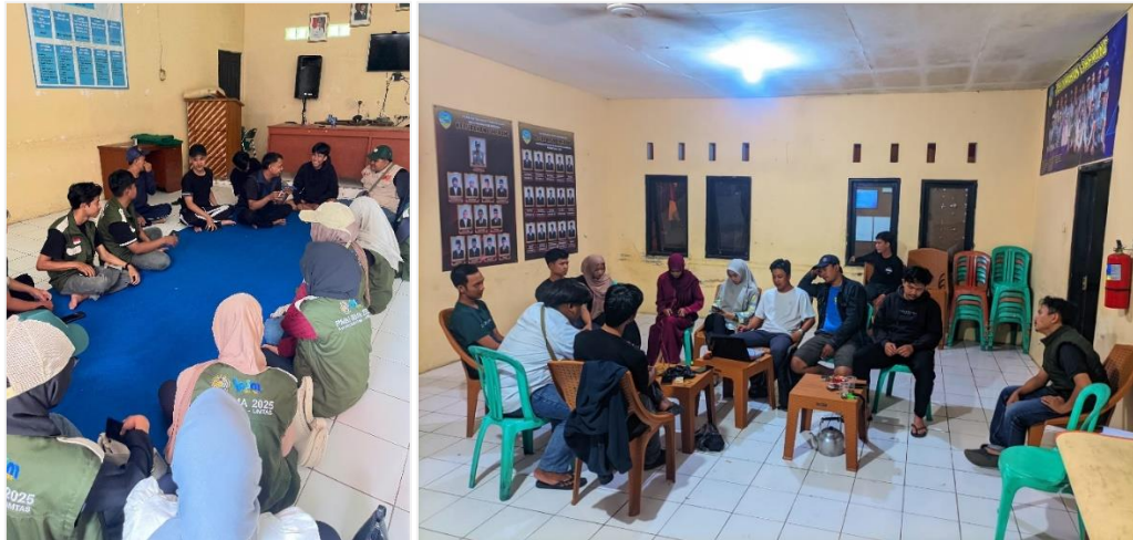
Gambar 1. Musyawarah dalam merumuskan penyelenggaraan turnamen voli perdana.