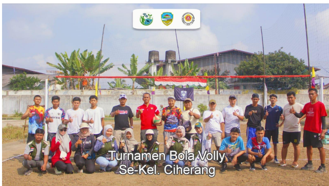
Gambar 4. Dokumentasi H1 pembukaan turnamen voli

Kota Tasikmalaya adalah sebuah kota otonom di Provinsi Jawa Barat yang dikenal sebagai pusat kegiatan agama dan budaya. Kota ini sering dijuluki sebagai “Kota Santri” sekaligus “Mutiara dari Priangan Timur”. Selain itu, Tasikmalaya memiliki kehidupan sosial dan ekonomi yang aktif dengan masyarakat yang selalu berperan dalam berbagai kegiatan baik di tingkat nasional maupun daerah, seperti pada peringatan hari kemerdekaan. Dinamika sosial tersebut mendorong terlaksananya kegiatan bersama serta menumbuhkan semangat kebangsaan terutama dikalangan generasi muda.