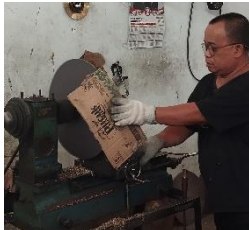
Gambar 10. Cutting Edge

Setelah dibersihkan melalui proses washing , cymbal memasuki tahap bubut ( lathing ). Proses bubut ( lathing ) merupakan proses pengikisan pada benda kerja menggunakan mata pahat, di mana benda kerja diputar dan dibubut untuk membentuk produk sesuai dengan bentuk yang diinginkan