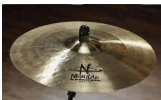
Gambar 14. Nebulae Asteroid

relatif besar di area permukaan cymbal. Ini terlihat pada cymbal Nebulae seri “Soleil” dan “Lunar Dry” namun hal tampilan yang di sebabkan oleh proses penempatan ini bukanlah hal sesuatu yang mutlak karena pembentukan suara juga sangat di pengaruhi oleh anatomi cymbal yang akan di jelaskan nanti.