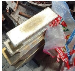
Gambar 2. Timah

Tembaga termasuk salah satu kelompok logam ringan yang sering digunakan oleh banyak orang karena keberadaannya yang melimpah di alam dengan kode ( Cu ). Menjadi bahan yang sangat penting dalam membentuk perunggu karena memiliki sifat yang mudah di tempa serta ulet. Tembaga memiliki sifat konduktivitas termal dan listrik yang baik membuatnya berdampak juga pada kemampuan menghantarkan getaran. Sifat ini membuat tembaga cocok digunakan dalam aplikasi yang melibatkan transmisi getaran, seperti dalam instrumen musik 21 .