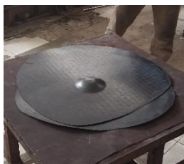
Gambar 8. Blank Cymbal

Setelah semua dianggap akurat, mesin dioperasikan. Bagian atas mesin menekan cymbal menggunakan cetakan bell, sedangkan bagian bawah membentuk bell. Proses ini memastikan bentuk bell yang tepat. Setelah tahap ini, cymbal memasuki tahap setengah pengerjaan dan disebut “Blank Cymbal”.