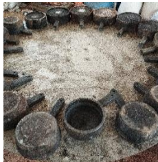
Gambar 3. Cetakan Billet

sekitarnya 29 . Cetakan ini disebut dengan cetakan billet, yang berfungsi membentuk perunggu cair menjadi bentuk billet untuk diproses lebih lanjut.