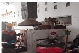
Gambar 7. Bell Stamping