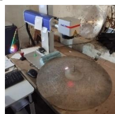
Gambar 18. Proses Grafir

Teknik grafir laser dapat menghasilkan sisa pembakaran yang menciptakan pola desain sesuai dengan yang diinginkan. 37