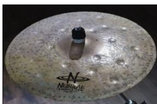
Gambar 15. Nebulae Lunar Dry