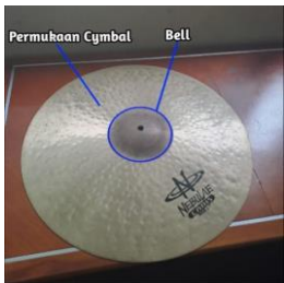
Gambar 21. Anatomi Cymbal

Cymbal yang telah dicetak sablon dengan logo perusahaan selanjutnya akan dikemas menggunakan plastik, kemudian ditempatkan dalam dus dengan desain yang menarik. Proses pengemasan ini bertujuan untuk melindungi cymbal selama pengiriman.