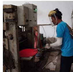
Gambar 5. Proses Rolling Mill

pembentukan logam menjadi bentuk setengah jadi dengan menerapkan gaya tekan yang menyebabkan deformasi plastis. Logam ditekan oleh gulungan, menghasilkan gesekan dan tekanan tinggi yang mengurangi ketebalan, sehingga diperoleh ukuran sesuai yang diinginkan 30 .