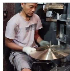
Gambar 12. Pen Hammer

Menurut penuturan Surya Sumirat pengaruh Hammering pada karakter suara dan tampilan fisik dapat di kenali sebagai berikut cymbal dengan karakter bright cenderung mengalami mengalami proses penempatan menggunakan mesin dengan ujung pen hammer berukuran kecil dengan intensitas jarang sehingga menghasilkan tampilan bopeng kecil dan halus, seperti pada cymbal Nebulae seri “Asteroid” dan “Canis”.