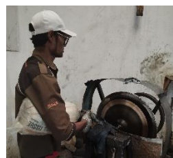
Gambar 17. Painting

Biasanya, logo tersebut berukuran kecil dan ditempatkan pada permukaan cymbal.