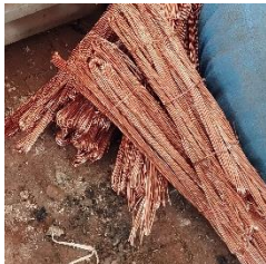
Gambar 1. Tembaga

Perunggu ( CuSn ). Sejarah perunggu yang digunakan untuk keperluan bunyi bunyian diyakini telah dimulai sekitar tahun 5000 SM. ketika ahli kimia dan pekerja logam menggabungkan tembaga yang di campur dengan timah 20 . Dimana kedua sifat dari bahan tersebut sangat mendukung.