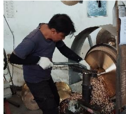
Gambar 11. Bubut ( Lathing )

Cymbal diletakkan pada mesin bubut dan diputar otomatis, sementara operator menggunakan alat bubut untuk mengikis permukaan. Setelah proses bubut, cymbal ditimbang untuk memastikan berat sesuai spesifikasi. Jika belum mencapai target, proses lathing dilanjutkan hingga mencapai berat yang ditetapkan.