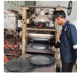
Gambar 6. Hasil Rolling Mill

Pada tahap ini, billet digiling untuk menipiskan material dengan memanaskannya dalam oven hingga mencapai suhu 805°C, sehingga billet lebih mudah ditekan. Proses ini dilengkapi dengan fitur pendingin pada mesin rolling mill .