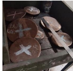
Gambar 4. Billet

Proses penuangan sangat penting dalam menciptakan bahan dasar billet yang sempurna, yang akan memudahkan langkah-langkah selanjutnya dalam produksi cymbal. Setiap jenis cymbal dirancang sesuai dengan ukuran yang diinginkan, dan berat billet bervariasi tergantung pada ukuran cymbal tersebut.