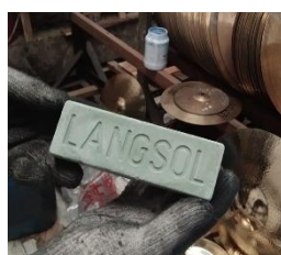
Gambar 16. Langsol

Setelah melewati seluruh tahapan kerja panas dan kerja dingin, proses pembuatan cymbal memasuki tahap akhir, yaitu tahap finishing. Pada tahap ini, fokus utama adalah memberikan tampilan akhir yang disesuaikan dengan seri cymbal yang akan diproduksi.