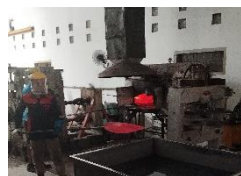
Gambar 8. Quenching

Sebelum itu, cymbal dipanaskan kembali dan siap masuk ke tahap bell stamping. Cymbal diletakkan pada mesin bell stamping dan disesuaikan menggunakan garis panduan berbentuk lingkaran dengan diameter berbeda di bagian bawah mesin, serta besi kecil sebagai patokan. Besi ini dimasukkan dari atas dan bawah mesin, yang memiliki lubang kecil sesuai posisi garis bantu. Garis panduan penting untuk menyesuaikan cymbal dan mengukur titik tengah yang akan dicetak menjadi bell dengan kapur barus.