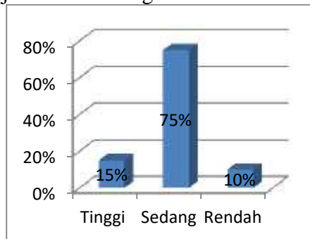
Grafik 3. Kategorisasi Keterampilan Teknik Kepala Sekolah

Hasil jawaban responden di atas dapat lebih dijelaskan dalam grafik di bawah ini: