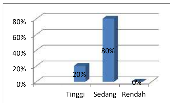
Grafik 2. Kategorisasi Keterampilan Kemanusiaan Kepala Sekolah

Hasil jawaban responden di atas dapat lebih dijelaskan dalam grafik di bawah ini: