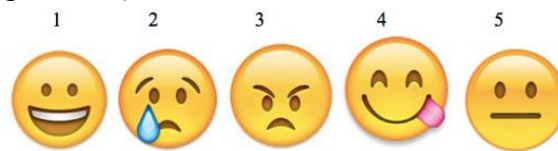
Gambar 1 Emoji ekspresi wajah

perasaan dan ekspresi wajah yang berbeda kepada anak ( emoji 1-5 di gambar 1).