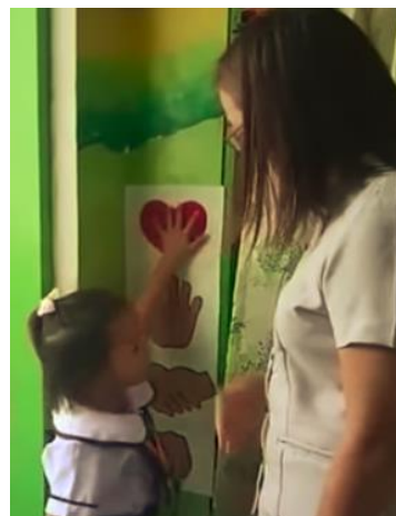
Gambar 4. Anak memilih emoji sebelum masuk ke kelas

Manfaat lainnya dari kegiatan ini adalah emoji dapat digunakan dalam berbagai kegiatan, selain untuk meningkatkan well-being dan kemampuan bahasa anak. Contohnya, penggunaan emoji sebelum kelas dimulai untuk meningkatkan nilai afeksi antara guru dan murid, dimana anak memilih emoji yang sesuai dengan suasana hati mereka kemudian menentukan jenis sapaan yang akan dilakukan bersama guru (memeluk, berjabat tangan, high-five , atau fist bump ), seperti terlihat pada gambar di bawah.