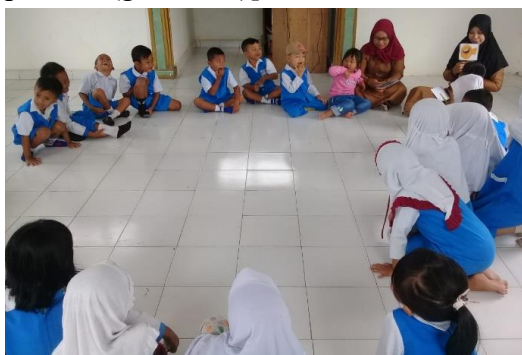
Gambar 3. Sebagian anak secara spontan menirukan ekspresi wajah emoji

Anak-anak :[spontan memperagakan gambar emoji yang ditunjukkan oleh peneliti (gambar 3)]