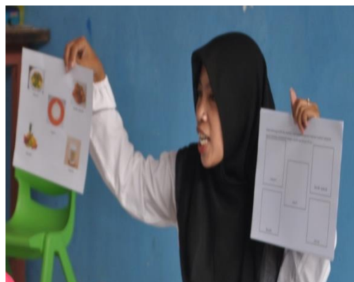
Gambar 2. Pembelajaran Makanan Sehat

Pembelajaran pada anak usia dini akan memperoleh hasil terbaik bila anak belajar pada sumber belajar yang mendekati riil atau media peraga konkrit atau mendekati konkrit. Selama ini alat peraga yang disajikan pada materi makanan sehat lebih banyak berupa gambar hasil foto copy atau cetak yang berasal dari majalah atau gambar di internet, yang kebanyakan dalam warna hitam putih. Di salah satu