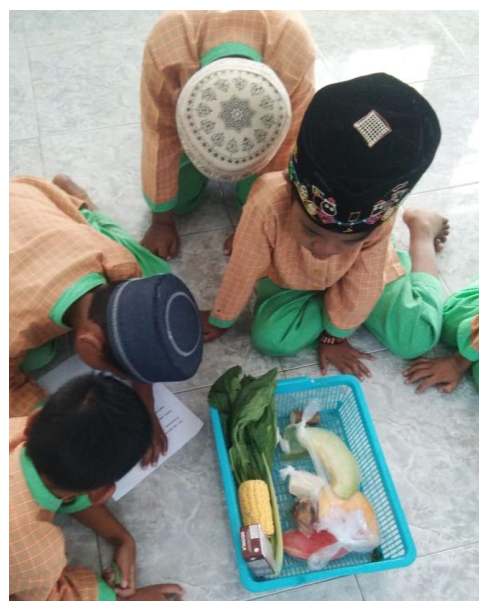
Gambar 11. Belajar Pangan Toyyibah

Keterampilan memilih pangan toyyibah merupakan suatu bentuk konstruksi hidup sehat pada masa mendatang yang harus dikembanglatihkan sejak usia dini. Pendekatan pembelajaran yang holistik dan memberi kesempatan pada anak mengembangkan kemampuan berpikir kritis dibangun melalui pembelajaran terstruktur yang disiapkan guru dengan bahan ajar, media, dan lembar kegiatan siswa (LKS) yang mendekati konkrit, yang mengajarkan anak pentingnya untuk membaca dan menulis yang bermakna. Disamping itu, konstruksi pengetahuan tentang kandungan berlebihan pada makanan seperti perasa, pewarna, atau pengawet dikenalkan pada atau gatal atau sakit perut seperti yang selama ini dikenalkan guru.