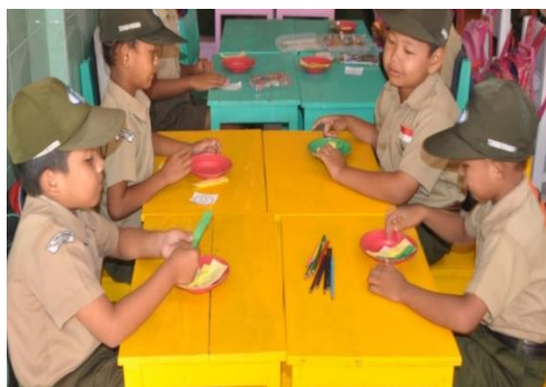
Gambar 10. Pembelajaran makanan sehat

Materi pembelajaran menerapkan pendekatan saintifik pada pembelajarannya, sehingga sangat penting menyiapkan bahan ajar dan media yang dapat diamati dengan berbagai cara oleh anak. Materi ini juga ditindaklanjuti dengan kegiatan bermain yang membutuhkan dasar pengetahuan dan mengembangkan keterampilan anak, tidak sekedar melakukan suatu kegiatan. Ragam bermain yang diterapkan dengan pendekatan kelompok mampu membantu anak yang lambat memahami konsep dengan bantuan temannya yang lebih cepat menerima pesan yang dikonstruksikan. Hal ini merupakan bentuk nyata scaffolding dan peran dari media seperti nampak pada gambar 10 dan gambar 11.