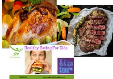
Gambar 6. Mengenalkan Pangan Toyyibah

1. Sumbernya baik > pangan halal yang diperoleh dengan cara yang baik