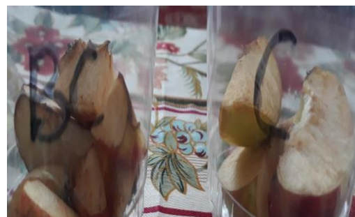
Gambar 10. Membandingkan apel yang dipotong dengan kondisi higienis dan tidak