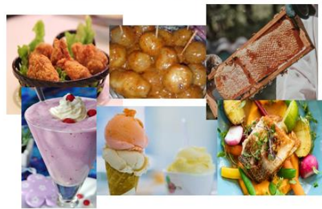
Pangan Halal Olahan

Gambar 5. Media berbentuk powerpoint Penerapan media dalam bentuk powerpoint seperti di atas membuat anak lebih mudah memvisualisasikan beragam jenis pangan sehat yang halal yang dapat mereka pilih. Visualisasi dengan media belajar yang ditampilkan menggunakan laptop ini juga membantu guru dalam membahas beragam jenis pangan dan kudapan yang berada di lingkungan anak-anak. Sebagaimana telah dituliskan sebelumnya penggunaan media canggih memiliki keterbatasan untuk diterapkan. Empat guru sebagai subyek dalam penelitian ini merupakan guru yang mengajar di wilayah perkotaan, sehingga laptop menjadi salah satu perangkat yang dimiliki oleh sekolah meskipun tidak untuk digunakan sebagai media pembelajaran sehari-hari. Media berbasis teknologi ini juga memiliki keterbatasan diakses anak karena alat yang kecil sehingga anak-anak harus bergantian untuk mencermati. Namun kualitas gambar yang lebih bagus daripada bila gambar tersebut dicetak hitam putih atau dicetak dengan ukuran kecil, maka penggunaan laptop yang dicermati bergantian jauh lebih baik membangun pemahaman anak.