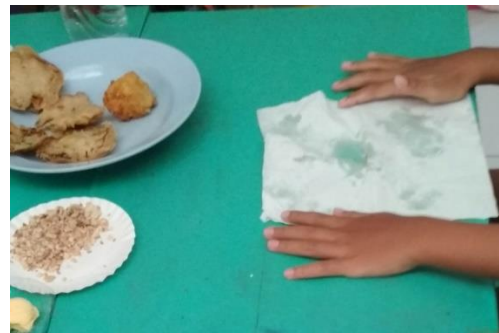
Gambar 9. Bereksperimen mengamati sisa minyak dengan tissue