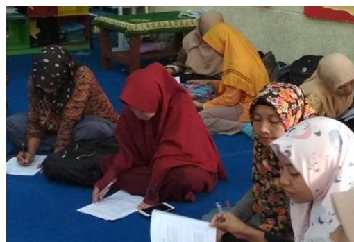
Gambar 1. Suasana Pelatihan Modul Pangan Thoyyibah

bahwa sebagian peserta akan dilatih untuk mengenalkan konsep pangan Islami dengan sudut penekanan pada makanan halal dan thoyyibah.