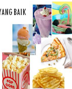
Gambar 8. Penjelasan Pangan Yang Kurang Baik

Pangan yang baik sebaiknya juga tidak mengandung banyak minyak. Minyak yang digunakan untuk menggoreng sebaiknya juga minyak yang warnanya masih bening. Bukan minyak dengan warna yang sudah coklat apalagi mengeluarkan bau yang tidak sedap. Minyak yang berlebih akan diendapkan oleh tubuh dan juga dapat menyebabkan gangguan kesehatan pada saat dewasa kelak. Minyak yang mengendap akan membunuh jalannya darah. (ingat percobaan dengan kertas minyak)