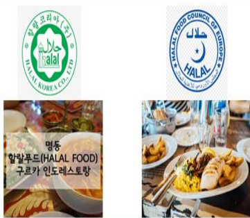
Gambar 7. Logo Halal berbagai negara