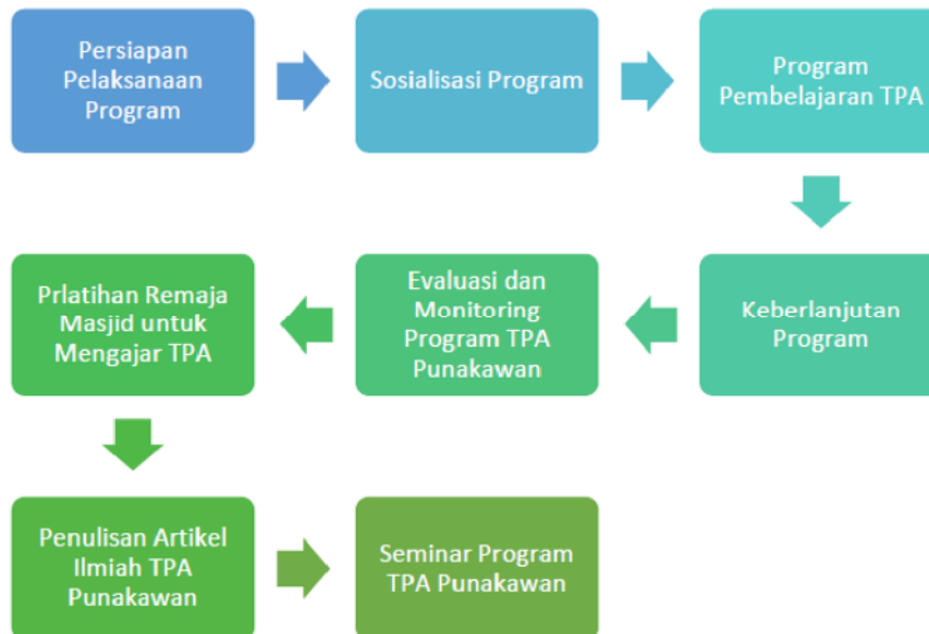
Gambar 1. Tahapan Pelaksanaan Program

Pemberdayaan yang dilakukan bersifat partisipatoris melalui kemitraan dengan Takmir Masjid dan Remaja Masjid At Taqwa dalam merencanakan dan menjalankan program-program kegiatan yang disepakati bersama. Guna mencapai tujuan yang diharapkan, maka disusunlah tahapan kegiatan dari persiapan, pelaksanaan, monitoring dan evaluasi program, serta keberlanjutan.