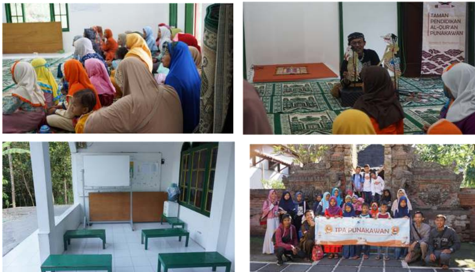
Gambar 2. Foto Kegiatan

Keempat , Rihlah Budaya. Rihlah budaya ini dilakukan ke museum budaya Sonobudoyo. Kegiatan bertujuan untuk mengenalkan budaya dan kearifan lokal Jawa kepada anak. Kegiatan ini sangat digemari oleh anak-anak karena sifatnya yang rekreatif dan langsung berinteraksi dengan benda dan pelaku budaya.