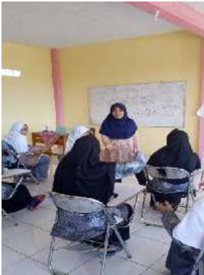
Gambar 3. Remaja yang antusias dan bertanya