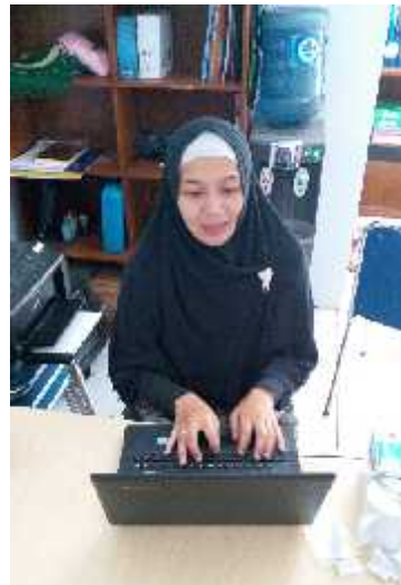
Gambar 4. Mempersiapkan materi