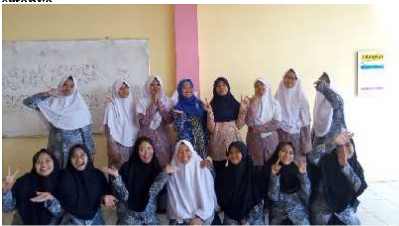
Gamabr 5. Setelah selesai acara sesi foto yang minat foto