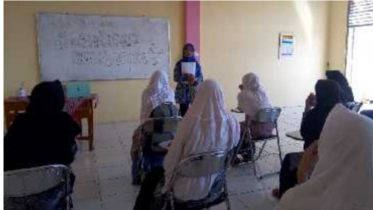
Gambar 2. Saat kegiatan sosialisasi berlangsung