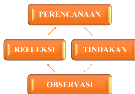
Gambar 1.1 : Siklus Spirial Kurt Lewin (Machali, 2022)

observasi aktivitas dan keterlibatan anak dalam mengikuti kegiatan cooking class , wawancara dengan guru kelas untuk menggali informasi terkait pelaksanaan tindakan, kendala yang dihadapi serta pemahaman anak setelah tindakan diberikan. Dokumentasi berupa foto kegiatan dan catatan kegiatan. Analisis data pada penelitian ini di peroleh model Kurt Lewin yaitu model paling awal Penelitian Tindakan Kelas, dibuat oleh Kurt Lewin. Model ini menjadi dasabagi banyak model penelitian Tindakan Kelas berikutnya. Setiap siklus Penelitian Tindakan Kelas (PTK), menurut Kurt Lewin terdiri dari empat langkah: perencanaan (planning), aksi atau tindakan (acting), observasi (observing), dan refleksi (reflection) (Machali, 2022). Adapun sebuah visualisasi siklus Penelitian Tindakan Kelas (PTK) model Kurt Lewin dapat dilihat sebagai berikut: