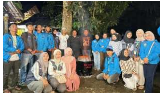
Gambar 2. Sosialisasi dan Demonstrasi