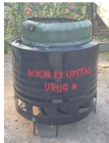
Gambar 3. Produk INSAF