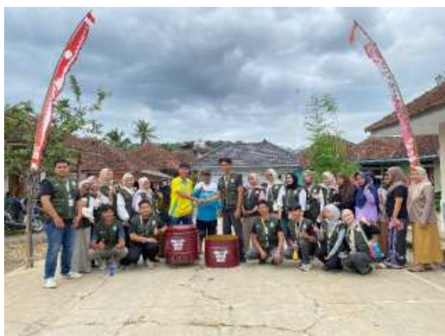
Sumber : Dokumen pribadi Gambar 3. Pendistribusian Combustion Furnace Drum RW 03 Tanjung

Saat berkunjung ke Desa Jati Bali, penulis mendapat kesempatan berharga untuk menyaksikan tradisi mendak dan upacara ngaben. Mendak adalah upacara pemanggilan leluhur Berikut hasil implementasi combustion furnace drum yang sudah di distribusikan: