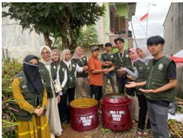
Gambar 2. Pendistribusian Combustion Furnace Drum RW 02 Cipawela