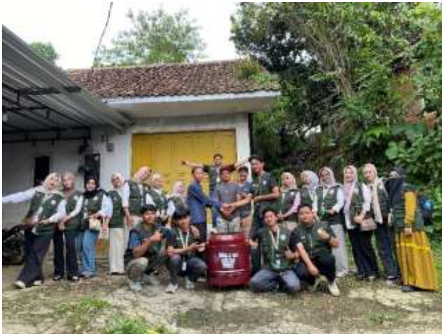
Gambar 1. Pendistribusian Combustion Furnace Drum RW 01 Ciwangsa